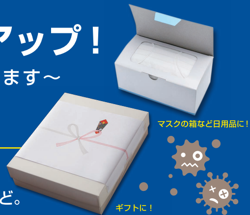
マスクの箱など日用品に!

商品パッケージ、携帯マスクケース、宅配用メール便型パッケージ、包装紙、ティッシュボックスカバーなどの日用品、飲食店のPOPなど。